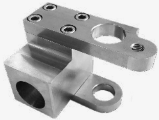
1 BAUGRUPPEN AUS BEARBEITETEN KOMPONENTEN

ELCEE bietet an Best-Cost-Standorten hergestellte maßgefertigte Industriekomponenten und Baugruppen. Unsere Spezialisierung besteht in der Fertigung von bearbeiteten und zusammengesetzten Guss- und Schmiedeteilen sowie Schweißkonstruktionen in kleiner und mittlerer Stückzahl. Unsere Ingenieure helfen Ihnen dabei, Ihre Komponenten zu kosteneffektiven Produkten umzuwandeln. Dabei setzen wir bei Ihren spezifischen Bedürfnissen an und sind in der Lage, aus unterschiedlichem Material herzustellen, inkl. Stahl, (Duplex-)Edelstahl, Aluminium, Eisen, Messing, Metall sowie Kunststoff. Als Produktions- und Baugruppenprozesse bieten wir wie zum Beispiel Guss, Spritzguss, Schmiedeteile, Sintern, Schweißen und maschinelle Herstellung.