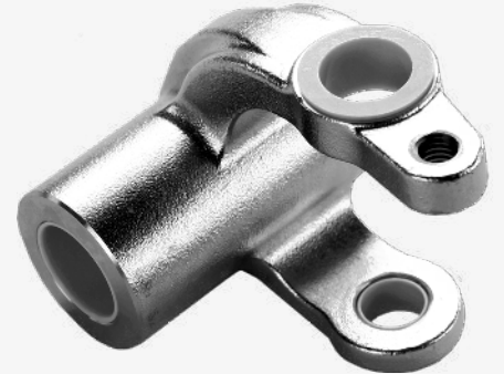
5 ENDPRODUKT ELCEE