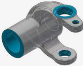
2 3D DESIGN